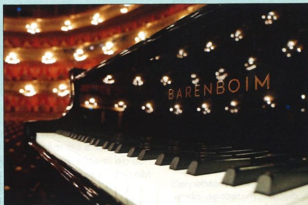
TILO KRAUSE / DG

Su madurez, su lucidez musical alcanzan tal grado de belleza, de introspección, de hondura, de imaginación y de la más excelsa musicalidad que me parece